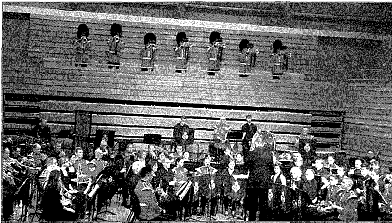
Kuncert kongunt ta' Eynsford Concert Band u l-banda ta' Grenadier Guards fil-Pamoja Hall gewwa Sevenoaks, Kent

Wara t-tmeninijiet insibu diversi baned militari Brittaniċi miġjuba sabiex jagħmlu diversi kuncerti u master classes. Dawn il-baned li qegħdin insemmu ġabu magħhom diversi strumenti ġodda, bħad-drum kit, li ġew introdotti fl-istrumentazzjoni. Ir-raba' figura hija Eynsford Concert Band li kienet mistiedna mit-Taqsima Kultura Tal-Ministeru Tal-Affarijiet Barranin Kultura u Żgħażaġh flimkien mal-Għaqda Kulturali Raħal Ġdid u Hal Tarxien. 8 Dan il-kuncert ġie mtella' t-Tlieta, l-1 ta' April 1986 (ara l-ħames figura). Eżempju ieħor ta' dan narawh fit-8 ta' Awwissu fl-1988 fil-Belt Valletta taħt id-direzzjoni ta' Dewi Jones (ara s-sitt figura).