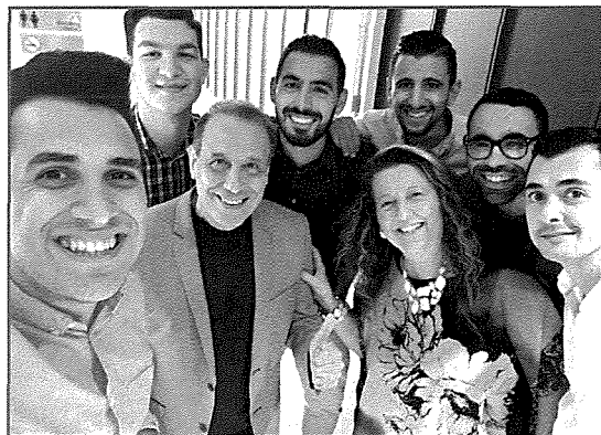
Il-Greenfields flimkien ma' The Travellers.

Li l-mużika m'għadhiex dak li kienet huwa fatt. Però naħseb din hija sentenza li kull 20 sena tista' tgħidha liberalment. Illum it-teknoloġija bidlet ħafna affarijiet li sa ftit żmien ilu l-anqas konna noħolmuhom. Avvanzajna ħafna f'dak li hu produzzjoni, irrekordjar