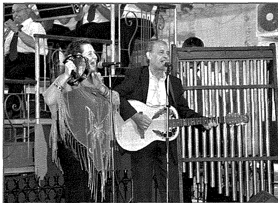
Kunċert tal-festa 2015 li fiha il-Greenfields kienu akkumpanjaw il-Banda San Ġuzepp.

Il-Hamrun huwa minsuġ magħna b'mod naturali ħafna. Aħna t-tlieta konna mwielda l-Hamrun għalhekk inħossu ruħna bħala Hamruniżi puri. Il-Hamrun kien il-post minn fejn tlaqna. Kellha tkun dik il-folk mass li hareg biha Dun Ġuzepp Pace eks Kappillan tal-Hamrun li bdiet