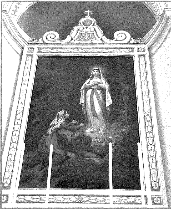
Il-kwadru tal-Madonna tar-Rużarju

Fil-knisja parrokkjali ta' San Gejtanu fil-Hamrun huma bosta dawk il-kwadri li għandhom valur artistiku għoli u li ħarġu minn idejn artisti magħrufa sew fil-qasam tal-arti.