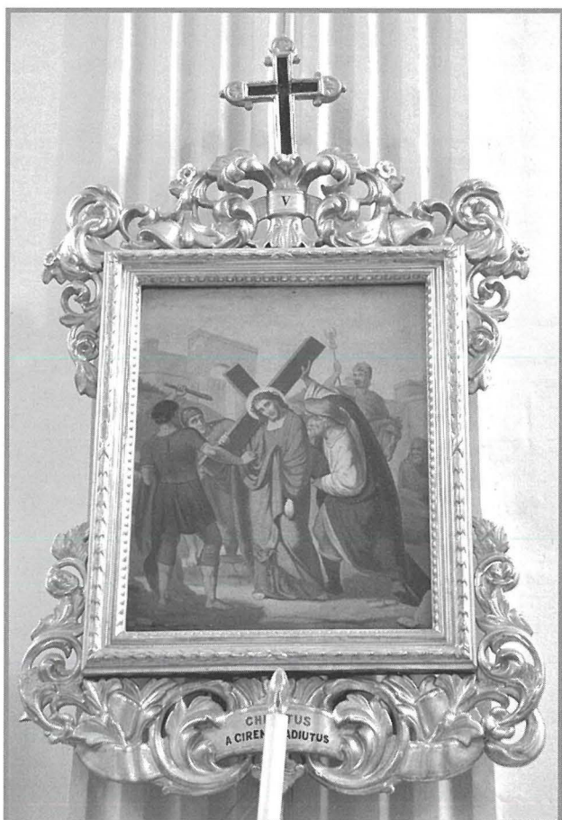
Wieħed mis-sett tal-kwadri tal-Via Sagra

b'hekk dan il-patrimonju qed jithares b' mod xieraq għal dawk li għad iridu jiġu warajna. Il-festa t-tajba lil kulhadd.