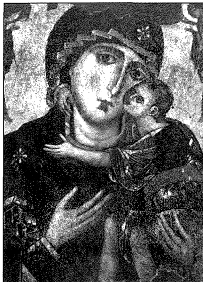
Ikona antika tal-Madonna ta' Damasku, miġjuba Malta minn Rodi mill-Kavallieri ta' San Ġwann fl-1530 u meqjuma fil-Knisja Griega ġewwa l-belt Valletta

Reċentement, il-kwadru ġie restawrat. Wara r-restawr, il-kuluri harġu hajjin hafna. F'gheluq l-1500 sena mill-konċilju ta' Efesu, li kien ġie ċcelebrat fis-sena 431, meta Marija ġiet magħrufa bhala omm Alla, il-kwadru ġie inkurunat solennement. Għalhekk, dan kien fl-1931. Ta' sikwit ninsew li din tal-Grieg hi knisja parrokkjali, għalkemm għall-kattoliċi ta' rit grieg. Għalhekk, kemm-il darba ġara li tagħrif dwar dan il-kwadru artistiku ma jingħatax meta jinkiteb fuq il-knejjes parrokkjali.