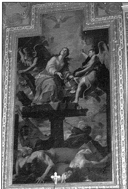
Santa Katerina – Żurrieq

Sannat f'Ghawdex lejn l-1675. Jekk jixxebbah ma' ohrajn ta' l-istess pittur, lil dan narawh hafna iżjed sempliċi. Santa Margerita hi l-figura waħdanija; imma magħha hemm hafna dettalji ċkejknin ohrajn. Fost il-kwadri titulari ta' Ghawdex, dan hu l-eqdem wiehed.