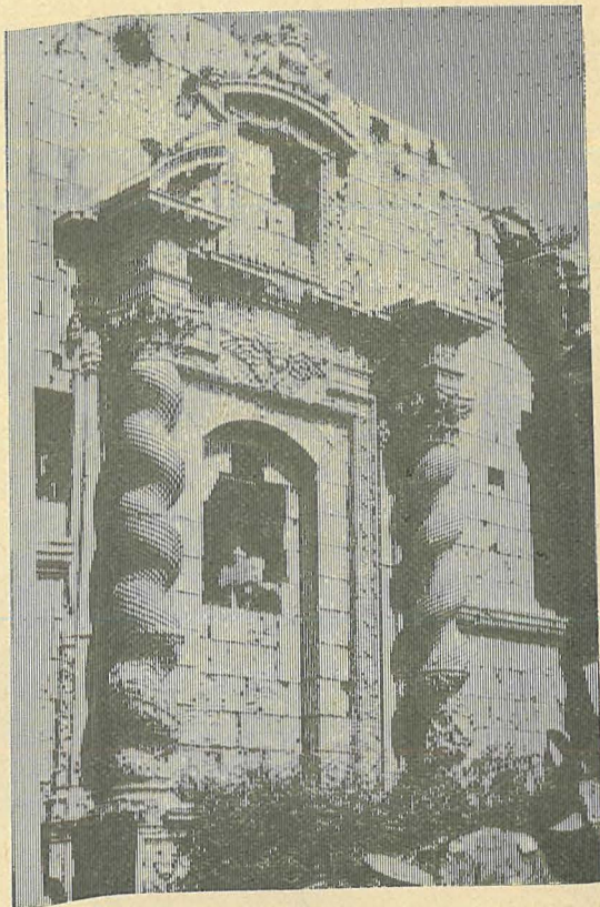
L-Artal Principali tal-Knisja l-Qadima

Fl-1575, u eżattament il-Ġimgħa, 21 ta' Jannar. Mons. Dusina ta bidu għall-Viżta tiegħu. Hu ma damx wisq ma wasal fir- rañal tas-Siġġiewi. Kien it-2 ta' Frar ta' dik