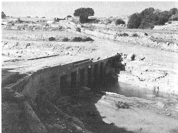
IL-ĤSARA LI HALLA WARAJH IL-MALTEMP

Minn dan biss diġa' rajna li ahna għandna parti kbira mill-ħtija tal-ħsara li ġrat. U hawn nixtieq insaqsi: Kemm se ndumu ma naqtgħu dal-miżħut vizzju li narmu barra, speċjalment skart goff fil-widien? Għaliex jaħsara ma nċemplux lill-Bulk Refuse, u dawn jagħmlu appuntament magħna u jiġu jeħdu minn wara biebna?