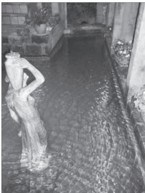
Għajn tal-Fassel in f'Ortigia, Sirakuza