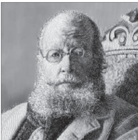
Edward Lear (1812-1888)

Il-Għajn il-Kbira kienet ukoll waħda mix-xeni tal-kampanja Għawdxija li laqtet lill-kittieb u pittur ingliz Edward Lear (1812-1888).