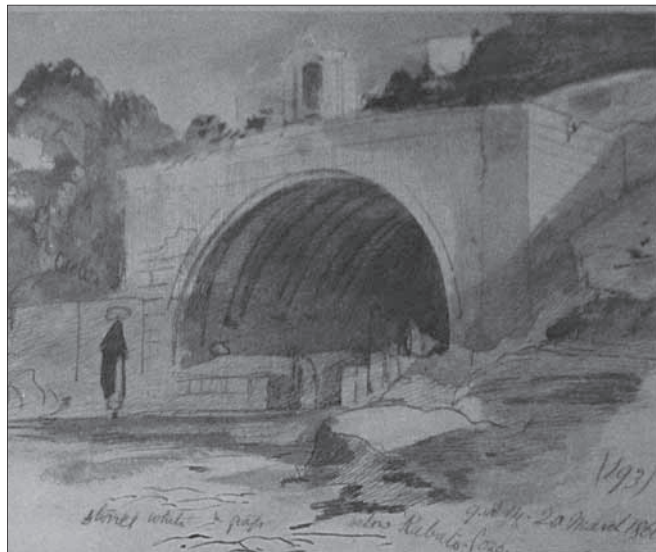
Gran Fontana (Rabat, Gozo), Edward Lear, 1866

It-tpingija tal-Għajn il-Kbira, imsemmija bħala 'Gran Fontana' u li illum tinsab fil-Mużew Nazzjonali tal-Arti, fil-Belt, Valletta saret fl-20 ta' Marzu 1866.