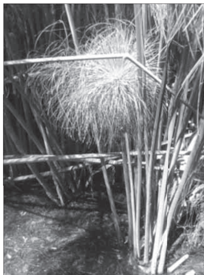
Ix-xitla tal-Papiru fejn il-Fontana Aretusa

Ta' min jinnota illi s-siġra tal-qasab hija indikazzjoni ta' ilma ġieri fl-inħawi ta' fejn tikber. Saħansitra, xitla qaribha tagħha – il-papiru – apparti illi kont issibha bl-abbundanza maġenb ix-xmara Nil fl-Egittu, għadek issibha b'mod speċjali max-xmara Caine f' Sirakuza fi Sqallija. Fil-gżira t'Ortigja f'Sirakuza wkoll insibu l-papiru tikber maġenb għajn ta' ilma ġieri magħrufa bħala Fontana Arethusa 8 .