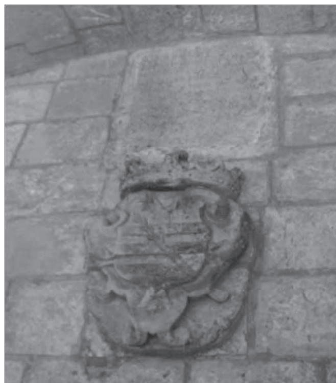
L-Iskrizzjoni fuq l-Arma

Il-fatt li nħasset il-ħtieġa li titwaħhal kitba f' dik il-għajn turi kemm dak il-post kien importanti fil-ħajja ta' Għawdex u r-rabta tiegħu mal-ħajja ċivika ta' din il-gżira.