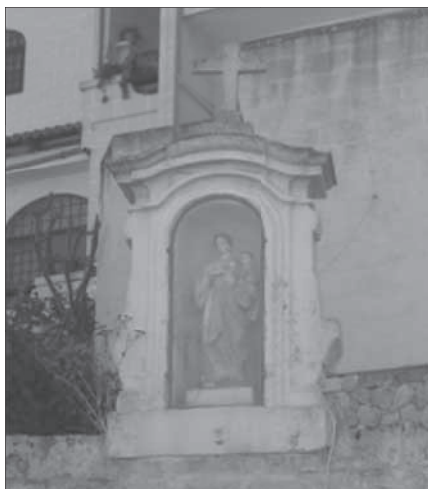
In-niċċa tal-Madonna tar-Rummiena

Fuq l-Għajn il-Kbira wieħed jista' jilmaħ niċċa bi statwa tal-Madonna tar-Rummiena li jingħad li kienet issir festa għaliha quddiemha fix-xahar ta' Lulju. Għal din il-festa, il-Għajn kienet tiżzejjin bil-fjakkoli u bil-qasab li jikber bl-abbundanza, fl-inħawi (Vella Haber, 2012).