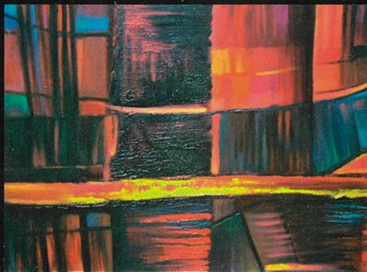
Awaiting the Resurrection mixed media fuq tila, 60 x 80cm Mark Sagona