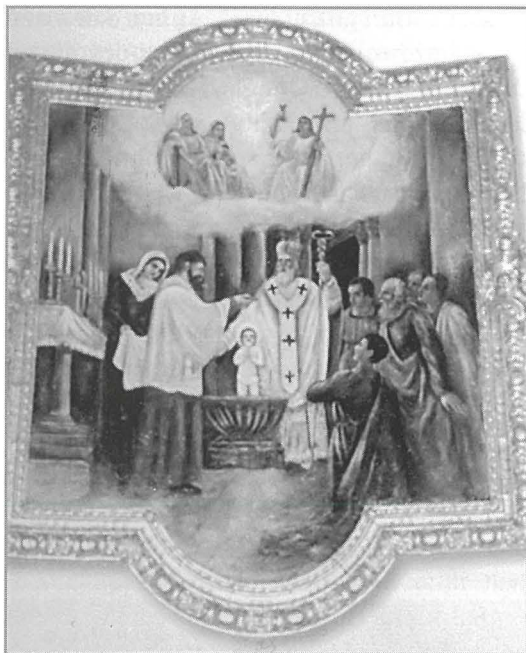
Il-Magħmudija ta' San Nikola

Wieħed mill-akbar studjużi tal-ħajja ta' San Nikola fiż-żminijiet tal-lum huwa Padre Gerardo Ciòffari, Dumnikan midhla tal-Bażilika ta' San Nikola f'Bari. Padre Ciòffari 2 jikteb ħafna artikli sbieħ fuq l-arti u l-ħajja ta' San Nikola. Ihobb jagħmel kritika xjentifika u dettaljata fuq it-tradizzjonijiet u l-legġendi li nibtu, matul is-sekli, dwar San Nikola. B'hekk