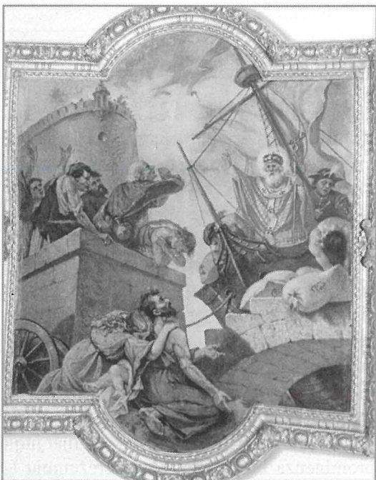
San Nikola jipprovdni l-Qamħ lill-Belt ta' Mira