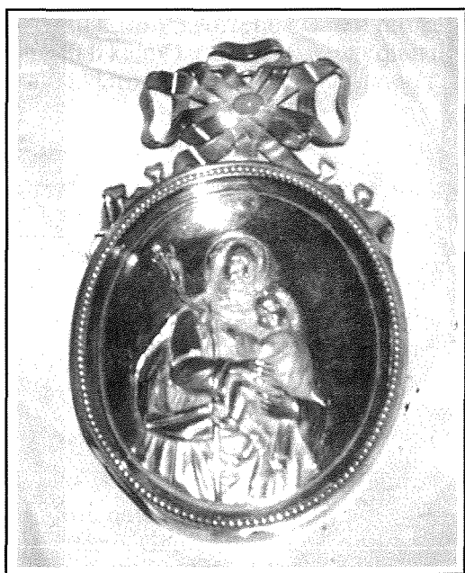
Il-midaljun tal-Konfraternità ta' San Ġużepp

Assessor F. Pullicino, u kien favorevoli. L-approvazzjoni giet mogħtija billi l-Arcisqof Pace Forno ħareġ id-digriet ta' l-erezzjoni fil-21 ta' Diċembru 1868. 23