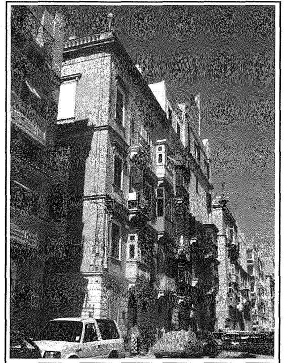
Bini fi Triq Pietro Floriani