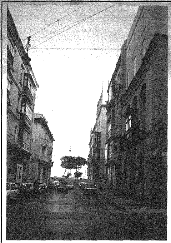
Triq Pietro Floriani