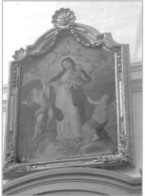
Fis-sagristija: Il-Madonna tad-Dawl