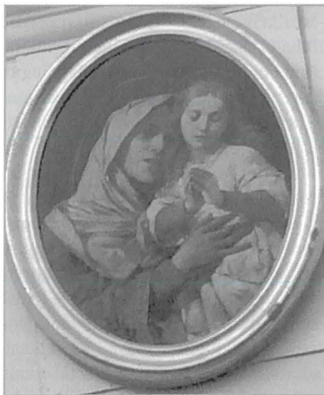
Fis-sagristija: Il-Madonna ma' Sant'Anna

San Kalcidonju huwa martri tal-ewwel sekli wara Kristu. Il-qima lejħ xterdet f'Malta mal-wasla tal-Ġiżwiti f'pajjiżna meta dawn bnew il-kunvent tal-Madonna ta' Manresa fil-Furjana (illum il-Kurja); infatti t-triq bejn il-ġnien tal-Argotti u l-Kurja sa ffit snin ilu kienet imsemmija għalih. Hu meqjus bħala l-protettur tan-nisa li jkunu ser iwelldu. Sal-ewwel snin tas-Seklu XX, San Kalcidonju kien popolari ħafna maż-żgħażaġh għax fir-Randan kienu jsiru l-eżerċizzi spiritwali għalihom hemmekk, il-post minnhom imsejjaħ propju San Kalcidonju . L-isem Kalċ, ukoll, kien popolari kemm fis-Siġġiewi kemm bnadi oħra.