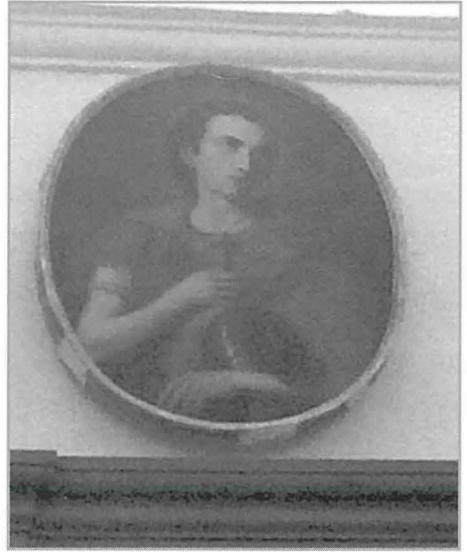
Fis-sagristija: San Kalcidonju

Nistgħu ngħidu wkoll li bis-saħħa u d-dedikazzjoni tagħhom ilkoll, dawn l-inkwadri żgħar reġgħu kisbu l-importanza u ħarsien li jixirqilhom. B'hekk nittamaw li nsalvawhom għall-generazzjonijiet ta' warajna.