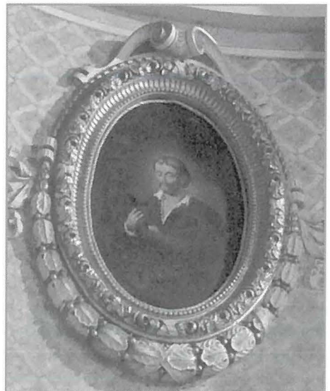
Fuq il-bieb tas-sagristija: San Lwiġi Gonzaga