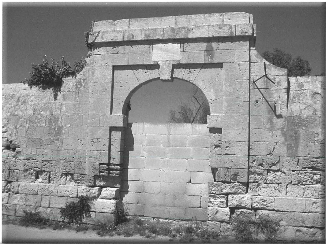
L-arkata tal-Gran Mastru Lascaris 1651

b' mod naturali, bħalma jsir qalb l-għoljiet f'ħafna partijiet tal-Italja. Mal-ġnub tagħha nsibu mrabat kbir li bihom kienu jorbtu l-btieti li fihom l-inbid jithalla jiqdiem u jitjieb. Milli jidher, din il-kantina forsi unika f'Malta, baqgħet tintuża għall-ħażna tal-inbid sa wara t-tluq tal-Kavallieri ta' San Ġwann minn Malta.