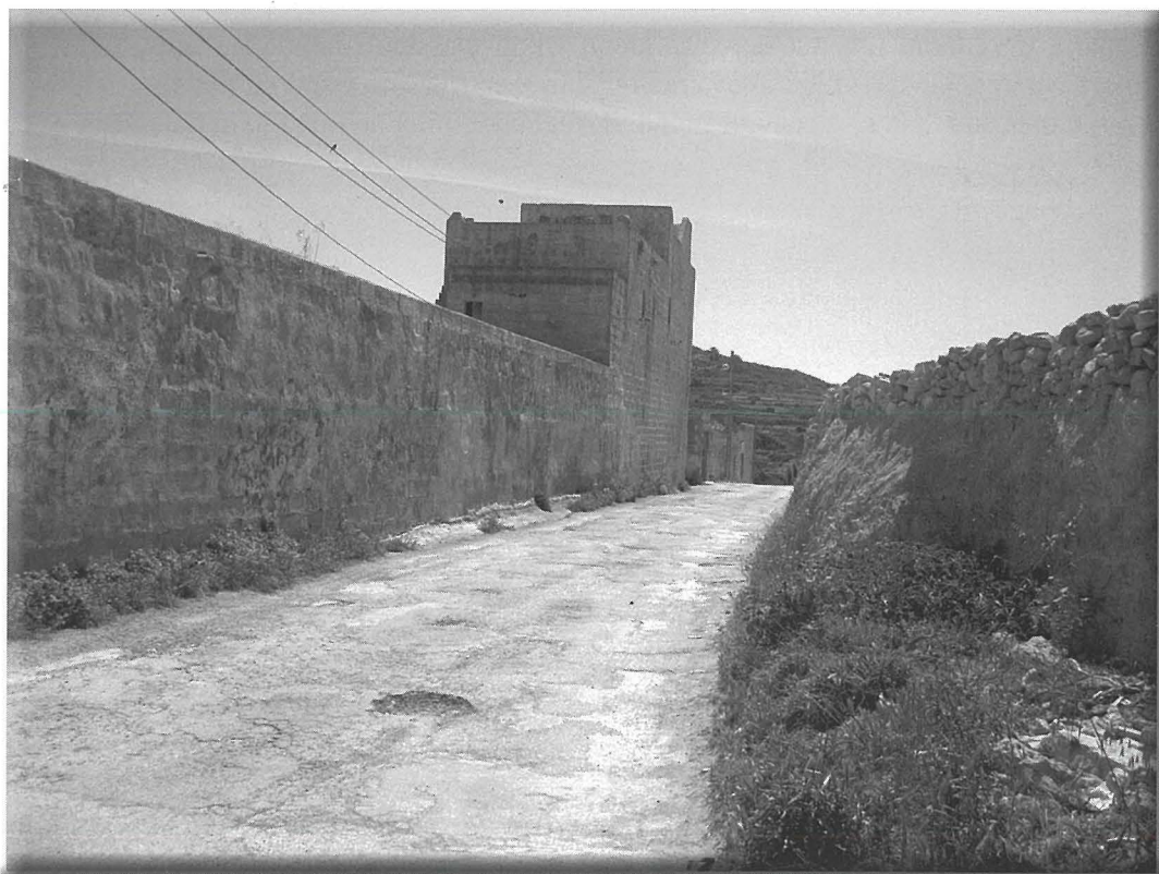
Fil-bini l-gholi kien jogghod l-Imghallem tal-Kumplex