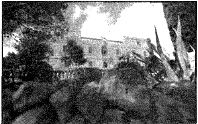
Il-Palazz tas-Sajf tal-Inkwizitur ġol-Girgenti.

Ta' minn itenni, li dan il-kas ukoll sehħ ftit xhur qabel Malta waqgħet taht il-Franċiżi. li allura nehew għal kollox it-Tribunal tal-Inkwizizzjoni. Giuglio Carpegna, fil-fatt, kien l-aħhar Inkwizitur u f'dawk l-aħhar jiem tal-Ordni, wiehed josserva li l-akkużi kollha quddiemu kienu ttrattati hafif u b'nofs qalb.