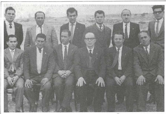
Il-Kumitat tal-Każin Lija Athletics F.C. ta' l-istaġun 1962.63, is-sena li fiha t-team akkwista l-ewwel promozzjoni tiegħu għat-Tieni Diviżjoni.