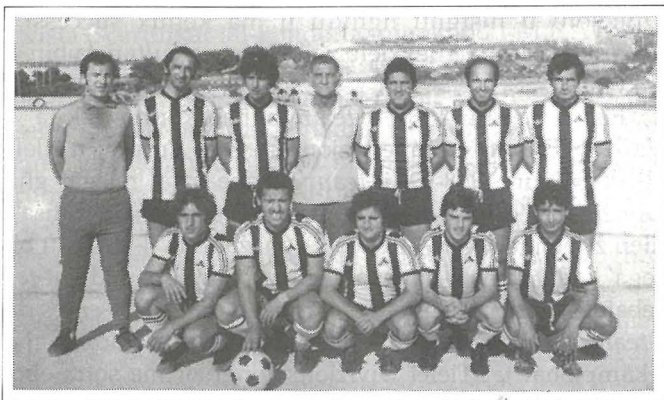
Stagun 1978/79. It-team kif lagħab meta rebah is-Sons of Malta Cup.

Minkejja l-progress kollu msemmi u d-dix-xiplina sportiva tal- players , meta