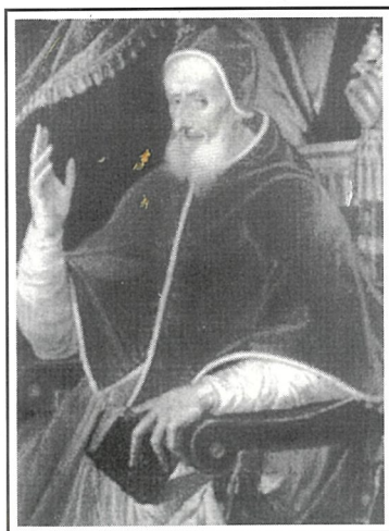
Il-Papa Piju V Għamel is-7 ta' Ottubru bħala l- ġurnata ddedikata lir-Regina tar- rużarju

Mikiel Ghislieri tweled fl- 1504 fil-villagġ ta' Bosco, hdejn Alessandria l-Italja ta' fuq. Il-ġenituri tiegħu kienu gabillotti f'qar hafna u ma kellhomx mezz biex jedukaw lil dan it-tifel intelligenti, li kien mogħni b' talenti kbar. Kien jirgħa l-merħla ta' missieru meta ġurnata waħda żewġ patrijiet Dumnikani ltaqghu miegħu u qagħdu jkellmuh. Meta raw li dan it-tifel intelligenti kien mibni fuq valuri b'saħħithom u tabilhaqq kristjani, dawn id-dumnikani talbu l-permess minghand il-ġenituri tiegħu biex jedukawh f'kullegġi mill-aqwa. Ta' tnax -il sena telaq mid-dar tal-familja tiegħu u ma rritornax lura qabel ma qaddes l-ewwel quddiesa, li kien hafna snin wara.