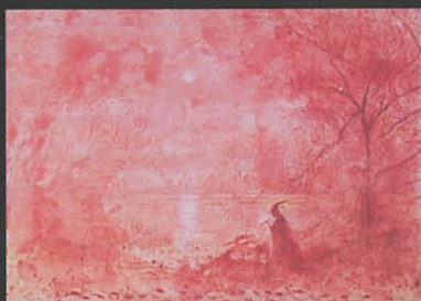
Adaġġo mdemmi Żejt fuq tila, 2008, 80 x 60cm Anthony Catania