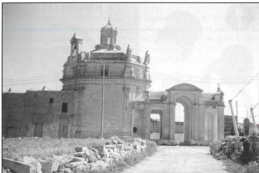
Il-kappella ddedikata lill-Madonna tal-Providenza li tinsab fil-limiti tas-Siggiewi.