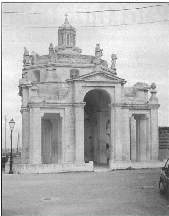
Dehra tal-faċċata tal-Kappella tal-Providenza.