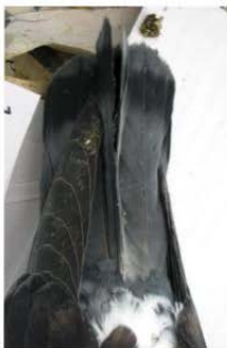
Denb uniku b'riħ magħqud mill-vina ta' hamieem Xiberras