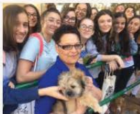
Zjarat giewwa l-Junior College u De La Salle