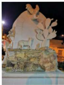
Monument iddedikat lill-akbar hbieb tal-bniedem - l-annimali