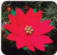
Ponsjettal Bħala Ornament

Il-ħames pass - Waħħal iż-żibeg/il-buttuni/il-karti fin-nofs.