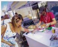
Waqt l-open day giewwa l-Għammieri

Barra minn dan, fil-Junior College l-istudenti zgħażaġħ ingħataw l-opportunitá li jitaqgħu ma' uffiċjali tad-Direttorat, kif ukoll li saret kampanja dwar l-użu tal-app AnimalWelfare Malta. F'De La Salle giet intelgħa preżentazzjoni dwar dak kollu li jwettqu l-haddiema tad-Direttorat u l-istudenti setgħu jsegwu kitten feeding mill-vidjio. Fl-afħar tas-sessjoni f'De La Salle assistejna għal ġest helu fejn l-istudenti pprezentaw kartolina kbira li għamlu huma stess lill-uffiċjali tad-Direttorat b'apprezzament għall-hidma li jwettqu.