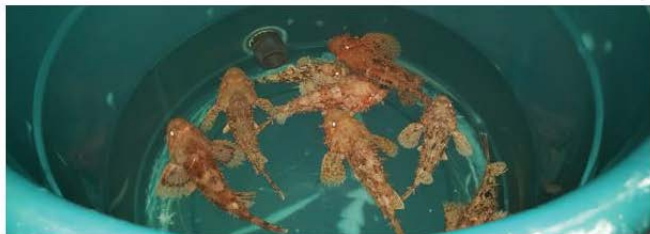
Numru ta' Ċippullazz, maqbud mis-salvaġġ, qabel tpoġġa fit-tankijiet, fiċ-Ċentru tar-Riċerka