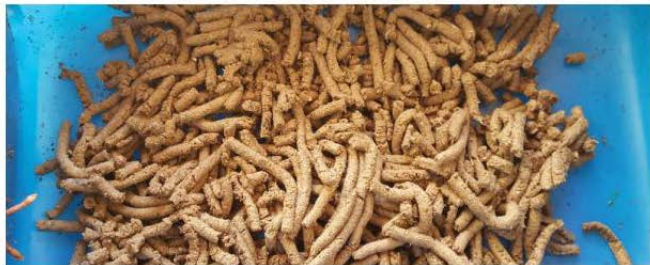
Fażi fil-preparazzjoni tal-moist pellet