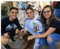
Giewwa l-Junior College