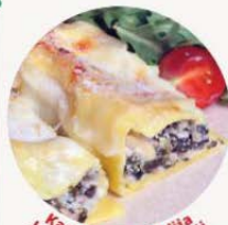
Kannelloni Mimlija bi-Irkotta u bi-Ispinaci

Qiegħed l-irkotta go skutella kbira u għaffiġha tajjeb. Magħha zid nofs il-gobon maħkuk, l-ispinaci mqattgħa f'biċċiet u hokk fit noċemuskata friska. Roux fit melh u bżar u hawwad tajjeb.