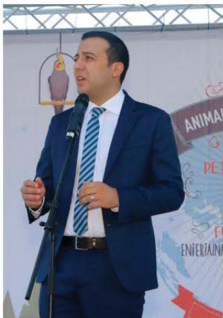
Bianchi/Leoni/Photo Agency - HESBC - Joseph Menecca