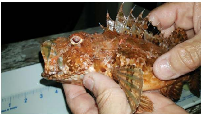
Cippullazza qabel ma tkejjel, bit-tag tidher cara max-xewka ta' daharha

Iċ-Ċippullazz inżamm taħt dan l-esperiment għal erba' xhur shaħ fejn il-livell tal-ossġenu, it-temperaturi u l-hin ta' dawli inżammu taħt kundizzjonijiet kostanti u fejn il-kwalità tal-ilma kienet tiġi ċekkjata kuljum. Kull f'mistax, kienu jitkeju l-piż u t-tul ta' kull individwu. Kull individwu kien qed jintgħaraf permezz ta' T-tag b'numru partikolari fuqha. Din it-tag ġiet imwafha max-