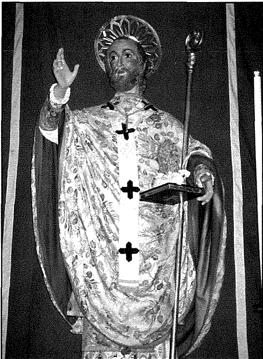
L-istatwa l-qadima ta' San Nikola li għadha meqjuma sal-lum fis-sagristija tal-knisja parrokkjali

tal-Isqof Luqa Buenos fl-1667 insibu deskriżżjoni ta' din l-istatwa: "vara bix-xbieha ta' San Nikola bis-suttana tiegħu, pavanozza", stola, amittu, ċinglu u bil-mitra tal-lama bajda mdawra b'gallun tad-deheb b'bizzilla tad-deheb fil-pendenti tagħha u b'ċurkett" 1