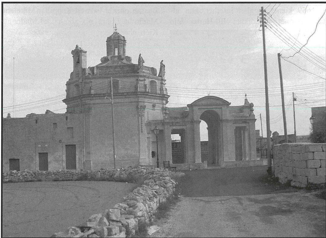
Il-Kappella tal-Providenza kif tidher mit-triq ewlenija li twasslek għaliha, int u ġej mis-Sigġiewi.

Il-festa fil-Knisja tal-Providenza kienet tiġi ċċelebrata fl-ewwel Hadd ta' Settembru. Fl-imghoddi hafna nies, kienu jimxu mis-Sigġiewi sabiex jaslu sa fejn din il-knisja. Illum, din il-festa ghadha tiġi ċċelebrata wkoll, għalkemm l-interess tan-nies naqas sew.