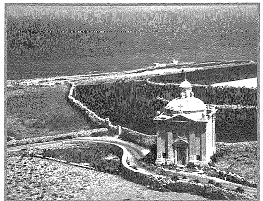
Dehra mill-ajru tal-kappella ta' San Nikola f'Taž-Żonqor

l-għassa tad-Dejma tas-sena 1417, iż-Żonqor jissemma. Fl-1504, f'dokument ieħor insibu referenza għall-knisja ta' San Nikola taż-Żonqor. Iktar referenzi nsibuhom f'atti notarili tas-snin 1536 u 1538. Meta Mons. Pietro Dusina għamel iż-żjara pastorali tiegħu għaxar snin biss wara l-Assedju l-Kbir, jiġifieri fl-1575 huwa rrimarka li din il-knisja kienet antika ħafna u kienet nieqsa minn ħafna bżonnijiet. Maż-żmien l-istat tagħha kompli jitgħarraq fejn saħansitra lanqas bieb ta' barra ma kellha. Dan wassal biex il-kappella giet profanata kemm-il darba. Minn żmien għal żmien kien jinjala' xi benefattur u jirrangaha, imma xorta kienet tibqa' nieqsa minn ħafna bżonnijiet u għalhekk kienet kull darba terġa' tisfa abbandunata u profanata. Fl-1659, l-isqof Balaguer iddeċieda li jagħlaqha darba għal dejjem.