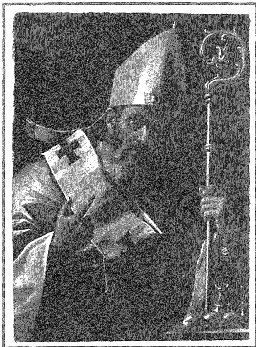
It-titular tal-kappella, xogħol attribwit lil Mattia Preti

Madankollu mitt sena wara li din il-knisja ngħalqet, bdiet tinbena dik li naraw illum. Dan kien fi żmien il-Granmastru Pinto u bil-permess tal-Isqof Rull. Din idarba nbriet ħafna isbaħ minn kif kienet qabel u għalhekk naraw arkitettura eleganti u sabiħa u msaqqfa b'koppla d-daqs tal-knisja kollha. Fi żmien tliet snin kienet lesta mill-bini u tbierket fis-sena 1762.