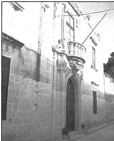
L-Iskola ta' Hal Lija fi Strada San Antonio.