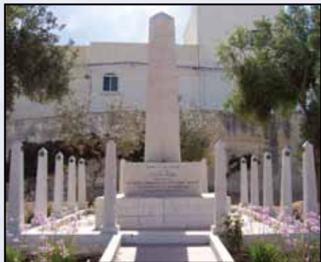
Monument lill-vittmi tal-gwerra Gappuniżi.

tlesta mill-binja tiegħu ġewwa Jar-row fil-11 ta' Marzu tal-1899, bahħar għal l-ewwel darba fi Frar tal-1901. Vapur twil 429 pied, bit-tmun fih 75 u nofs pied fil-waqt li għoli 26 u nofs pied. Jiżen 14 il-elf tunnellata u kapaċi jtella' velocità ta' 19 il-mil tal-baħar, dawn kienu jagħmluha wiehed mill-iktar vapuri tal-gwerra veloci ta' dak iż-żmien.