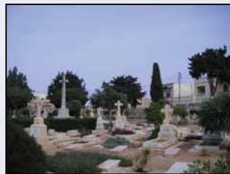
Dehra generali taċ-Ċimiterju Navali minn ġewwa.