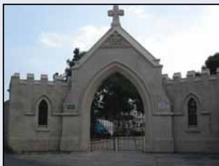
L-entratura prinċipali taċ-Ċimiterju Navali ġewwa l-Kalkara.

Meta xi ċimiterji ġewwa Malta kienu jinqalgħu u jiġu żviluppanti għal raġunijiet oħra, il-fdalijiet tal-mejtin kienu jittieħdu go dan iċ-ċimiterju u jerrgħu jiġu midfuna fl-oqbra tal-massa. Hawn, hemm midfuna dawk il-membri tal- British Services u l-familjari tagħhom li mietu bejn l-1865 u l-1913 u kienu oriġinarjament midfuna fiċ-ċimiterju navali tar-Rnella.