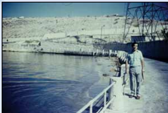
1973: L-awtur fil-bajja meta kienet ghadha fl-istat selvaġġ ta' tfulitna.