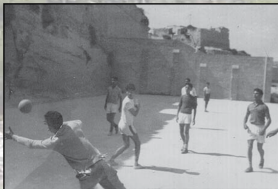
Snin 60: Żewġ waqtiet akkaniti minn loġħba futbol f'"Ditch Park" fil-foss tar-Rikażli.

nħobbu mmorru ta' sikwit nesploraw il-katakombi ta' taħt ir-rampa kbira li hemm thares għal fuq il-bajja. Kienet avventura oħra tat-tfal għax il-katakombi mhux biss kienu perikolużi