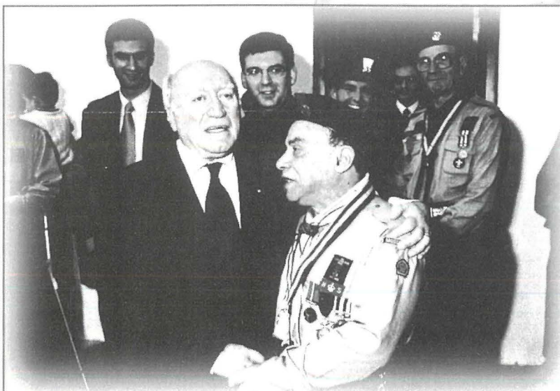
Il-President ta' Malta l-E.T. il-Prof. Guido de Marco jifraħ lis-Sur Charles J. Vella GSL meta ġie onorat b'għoti tas-Silver Dolphin

Fil-bidu tas-sena 1932, hekk kif il-Kurunell P.R. Worrall lahaq Island Commissioner ta' l-iscouts ta' Malta, huwa fetax kampanja qawwija għall-qawmien shih tal-Moviment ta' l-Iscounts ma' Malta u Ghawdex. Kull belt u rahal bdew