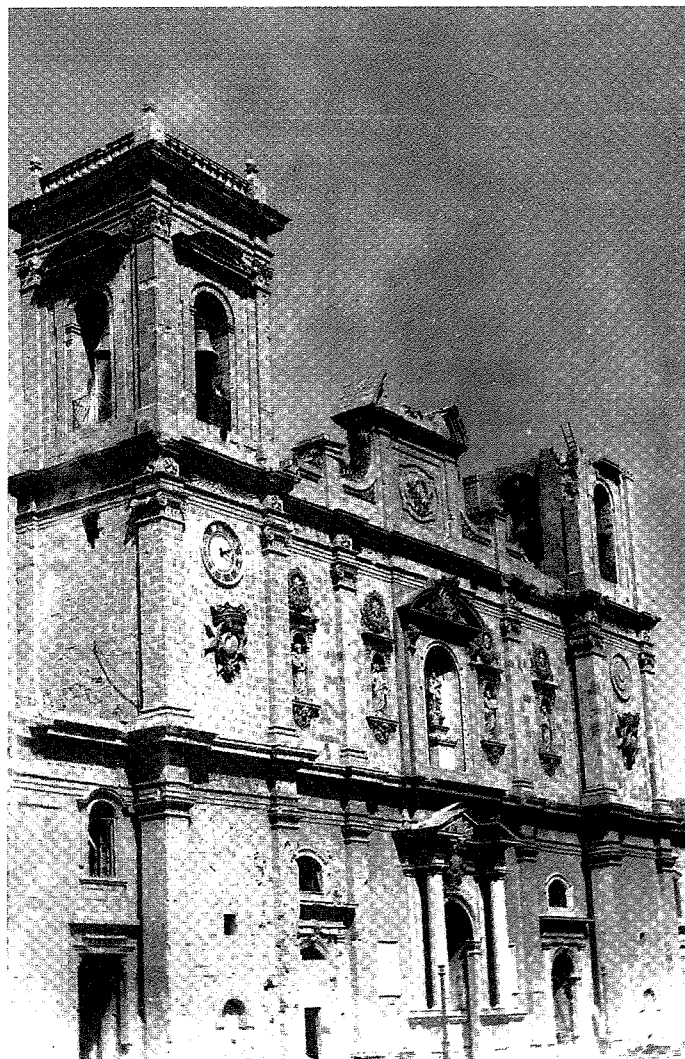
Il-faċċata l-antika tal-Kollegġjata-Bażilika tal-Isla.

Issa, minn post tad-divertiment jew ta' mistrieħ għall-kavallieri, saret belt ċkejna għall-Maltin.