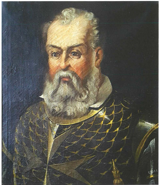
Il-Gran Mastru Klawdju De La Sangle.

Iżda din il-Belt l-iżjed li hi marbuta huwa mal-Gran Mastru Franciż Claude de la Sangle li lil hinn mill-ħitan tas-swar tal-fortizza ta' San Mikiel li fil-fatt hu kompli ħaxxen u saħħaħ, bena belt, waqqaf komunità bl-abitat u bil-kummerċ megħjun mill-bdiewa ta' madwar u sebbaħha b'dinjità ġdida.