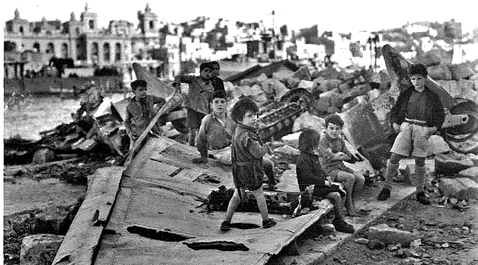
Tfal jilgħabu fuq fdalijiet ta' ajruplan imġarraf fix-Xatt tal-Isla fit-Tieni Gwerra.

Ir-riskju l-ieħor hu li wara li tkun ġarrabt id-dizastri, il-fallimenti, il-qerda, titef il-fiduċja f'Alla u titef twemminek. It-trawmi jdaghjfu ħafna l-fiduċja fid-dinja, fil-bniedem in genere u f'xulxin fil-komunitajiet u l-familji tagħna. It-tbatija -mitluqa waħidha - m'għandhiex il-kapaċità li tgħinek thobb iżjed: pjuttost tikkorompi l-kapaċità li thobb. Il-kollass arkitettoniku fil-bini, fil-bażilika, fl-iskejjel, fid-djarna ġewwa l-Isla seta' għab kollass ħafna iżjed profond, jiggifieri, fil-kapaċità li nemmnu f'xulxin, f'Alla jew fil-Knisja. Min jaf kemm mill-antenati tagħna hassew li forsi Alla abbandunahom, jew li ma kienx misthoqqilhom li jgħaddu minn dak it-tigrib u dik l-umiljazzjoni kollha. Studji li saru fost il-vittmi tal-gwerer kemm fl-