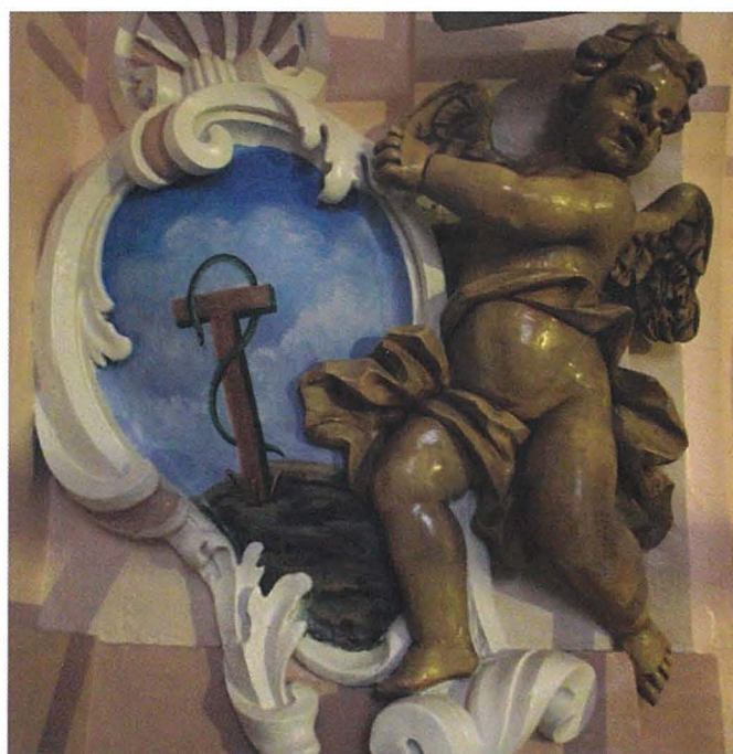
L-arma tal-Fratellanza tal-Kurċifiss taħt il-kurva tas-saqaf tal-Oratorju tal-Kurċifiss

Din il-Fratellanza twaqqfet fl-Isla fit-18 ta' Settembru 1715 fi żmien il-Kappillan Dun Mikiel Testaferrata. Hija intrabtet mill-ewwel mal-artal tad-Duluri fejn ġa kien hemm stabbilita l-Fratellanza tal-Madonna tal-Karità li iżda kienet ilha żmien sejra lura. Filwaqt illi l-għan ewlieni kien it-tkattir tad-devozzjoni lejn il-Passjoni u l-Mewt ta' Sidna Ġesù Kristu, hija wkoll