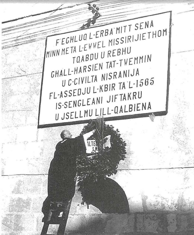
Tqeghid ta' kuruna tar-rand u tluġh tal-bandiera tal-Ordni fuq is-swar tal-Isla b'hal partii miċ-ċerimonja li saret fil-15 ta' Lulju 1965 fil-kommemorazzjoni tal-400 sena tal-Assedju l-Kbir