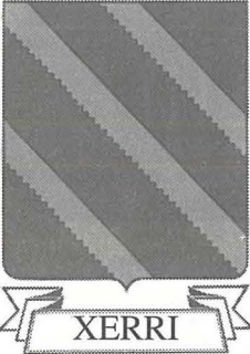
L-arma tal-kunjom Xerri: kunjom komuni fl-Isla.

Imma jekk nibqgħu sejrin hekk tiġi qisha litanija.