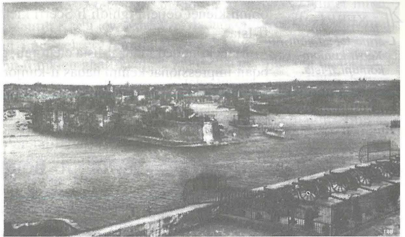
Ritratt antik li juri l-Isla min-naħa tal-Belt.

Il-kitba tagħna tas-sena l-oħra, dwar kunjomijiet barranin fl-Isla, qanqlet xi ftit reazzjoni: kien hemm min irid jaf għaliex ma semmejtx kunjomu, ngħidu aħna, kien hemm min qalli li kunjomu ried jiġi miktub mod ieħor, u kien hemm raġunijiet oħra, li nsemmuhom. Irridu ngħidu li jekk tosservaw, ridna nsemmu ċerti kunjomijiet barranin li huma barra mill-komuni fil-belt tagħna.