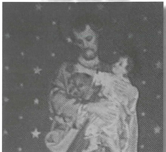
L-Istatwa ta' Qabel dik preżenti