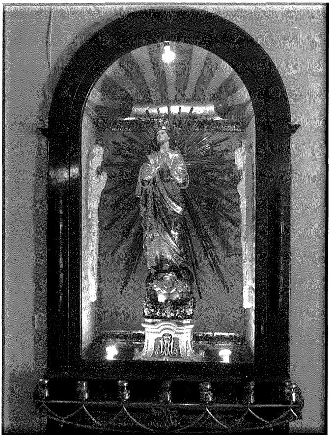
L-Istatwa ta' Marija Bambina fin-niċċa tagħha

Din il-knisja u x-xenarju ta' madwarha huma popolari ma' dawk dilettanti tal-fotografija u dawk li jhobbu jpittru l-ambjent naturali. Għalhekk insibuha ħafna fuq kotba u fi kwadri li juri s-sbuħija tal-kampanja ta' pajjiżna. Din il-knisja qiegħda tagħti gieħ lil Alla l-Imbierək u lil Ommna Marija Santissima fil-jum tat-twelid tagħha. Imma barra minn hekk qiegħda wkoll issebbah dan ix-xenarju pittoresk.