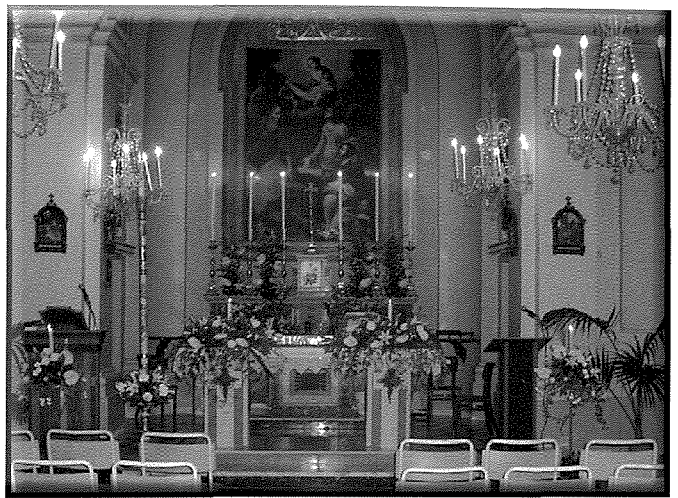
Dehra tal-Knisja minn ġewwa