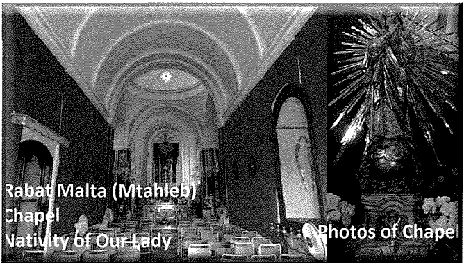
Rabat Malta (Mtahleb) Chapel Nativity of Our Lady