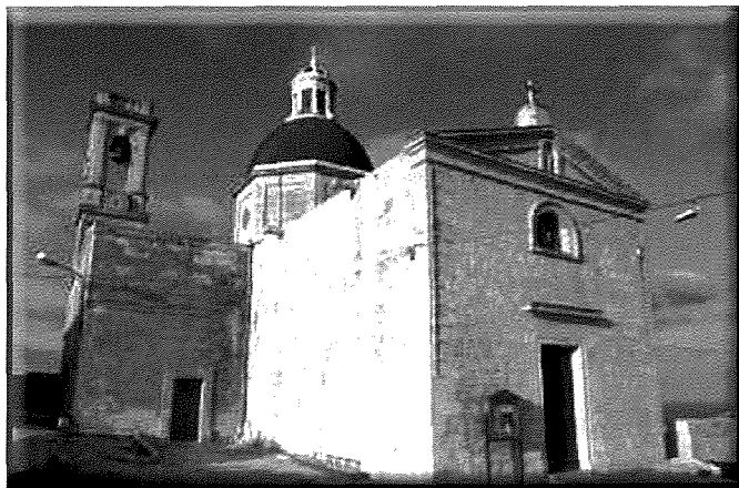
Il-Knisja ta' Marija Bambina tal-Imtaħleb