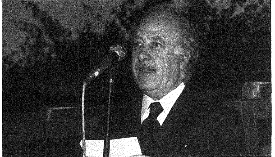
Hemm aspetti oħra tal-hajja ta' J.J. Cremona li ma tantx huma magħrufin bħar-rabtiet li kellu mal-arti

Semmejt in-narrattiva għax fil-konċiżjoni ta' kitbietu Cremona rrakkonta grajjiet bħal dik tal-kelb mejjet "in a knotted sack" midfun f'"shapeless hole"