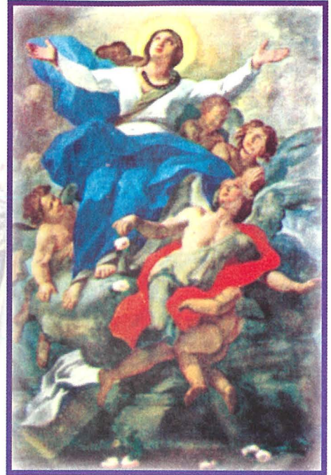
Il-Madonna tal-Flas Hal Qormi

Ta' Atoċja hadet post kappella ohra li qabel kienet dedikata lil San Nikola u li kienu farrkuha t-Torok tul l-