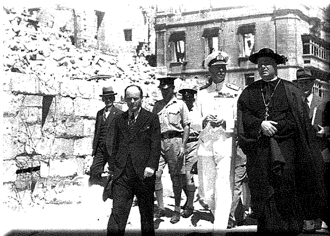
Ir-Re Ġorg VI mdawwar mal-Isla mill-Arċipriet Brincat fl-20 ta' Ġunju 1943.