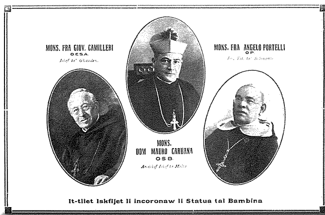
It-tliet isqfijiet li kienu l-protagonisti tal-inkurunazzjoni.

Aħna wkoll fil-belt tagħna għandna x-xorti kbira li għandna innu sabiħ u ta' ġieħ f'ġieħ Ommna Marija Bambina fil-jum tal-inkurunazzjoni tagħha li seħħet nhar l-4 ta' Settembru 1921, fix-xatt ta' beltna, eżattament quddiem l-ospizju Sant'Anna minn tliet isqfijiet – l-Arcisqof ta' Malta Dom Mauro Caruana, flimkien mal-