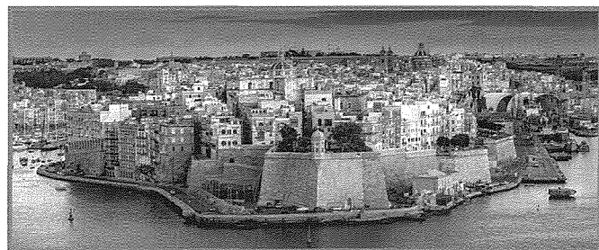
Il-Belt Senglea kif tidher mill-Barrakka ta' Fuq fil-Belt Valletta