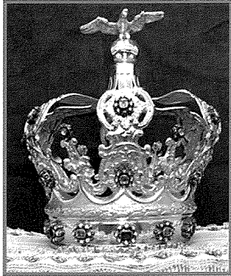
Il-kuruna tad-deheb u ħaġar prezzjuż li tqiegħdet fuq Ras il-Bambina mill-Arċisqof Mauro Caruana nhar l-4 ta' Settembru 1921

Jeżistu għadd ġmieli ta' dati storiċi ta' pelligrinaġġi oħra ta' talb, fejn l-istatwa tal-Bambina ħarġet mis-