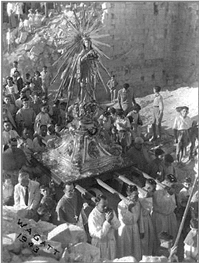
Il-purċissjoni bl-istatwa ta' Marija Bambina fl-1943