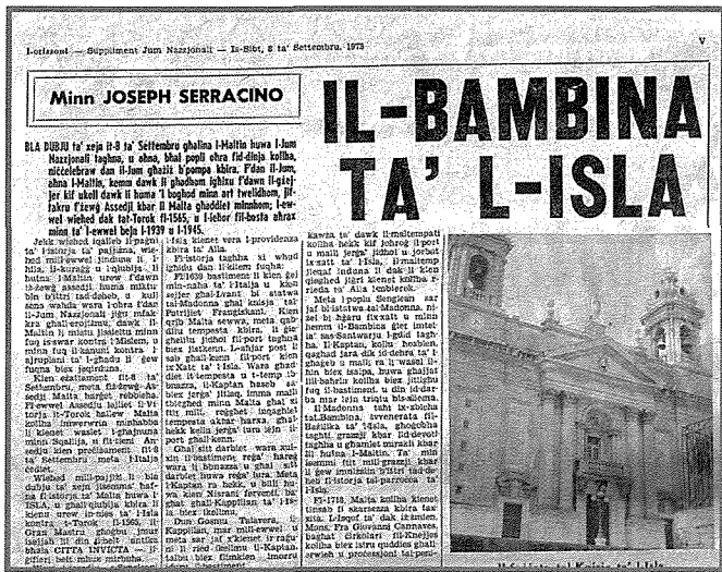
L-artiklu miktub mis-Sur Joseph Serracino dwar dati marbutin mal-Bambina tal-Isla fis-sena 1973

Nafu li għall-ewwel snin din l-istatwa kienet taħt it-titlu tal-Kuncizzjoni kif ukoll bħala l-Bambina kif nafuha llum. Fil-fatt, antikament, bl-istess statwa kienu jsiru żewġ purċissjonijiet fis-sena waħda fit-8 ta' Settembru u l-oħra fit-8 ta' Dicembru.