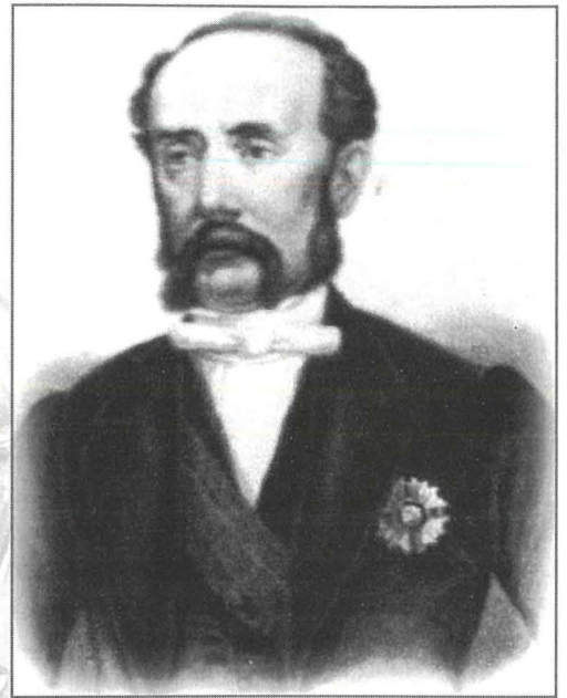
Tenent Gvernatur Sir Gaspard Le Marchant, Gvernatur ta' Malta (1858 - 1864)

Żgur li kienu ftit dawk it-tfal tal-Mosta li kienu jgħaddu għall-iskola sekondarja. Minn Malta kollha, fis-sena 1877, it-tfal li kienu jmorru fl-iskola sekondarja tal-Belt kienu 111 biss. 6