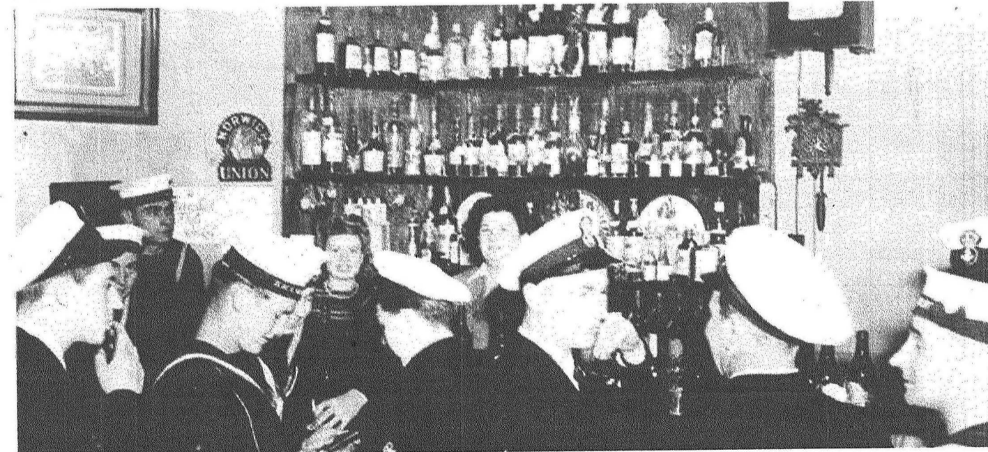
Ir-Royal Navy fi Triq id-Dejqa, fil-Belt