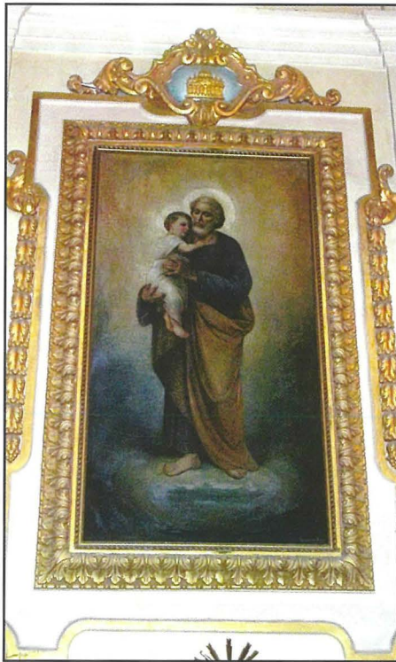
Il-kwadru ta' San Ġużepp gewwa l-Parroċċa tal-Madonna tal-Karmnu fil-Gżira.

kif ukoll idejh li tinsab tmiss għonq San Ġużepp bħal donnu jrid iwassal messagg ta' kemm Ġużeppi f'ħajtu verament ha ħsieb lit-tfajjel Ġesù bl-aħjar mod li seta', kif ukoll bl-aktar mod rispettat. Dan huwa ċertament prova ċara ta' kemm San Ġużepp jisthoqqlu verament it-titlu ta' missier putattiv ta' Ġesù, liema titlu, San Ġużepp huwa meqjus bl-akbar għozza.