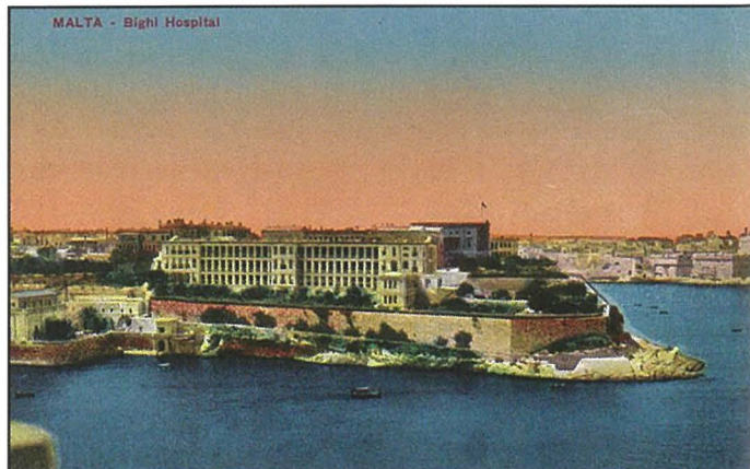
Postcard antika ta' Villa Bigħi

Ix-xogħolijiet tlestew fl-24 ta' Settembru 1832, bi spiza totali ta' £20,000.