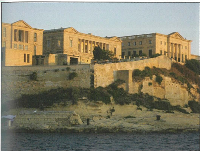
Dehra ġenerali ta' Villa Bigli mid-dahla tal-Port il-Kbir.

L-arkitettura fuq in-naħat tal-Punent u Lvant hija ta' stil modern Doriku u mibnija b'sulari għoljin. Taħt iż-żewġ binjiet hemm passagġ wiesgħa użat matul il-bini għat-trasportazzjoni ta' xi materjali. Ix-xogħlijiet kienu jinkludu t-twaqqiegħ tal-ġnub annessi biex jagħmlu spazju għaż-żewġ żoni li kien ippropona Dr. Snipe.