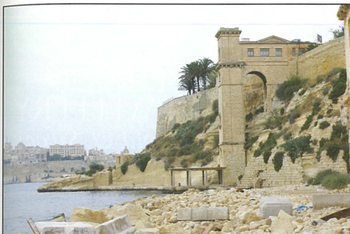
Dehra tal-lift ta' Villa Bigli.