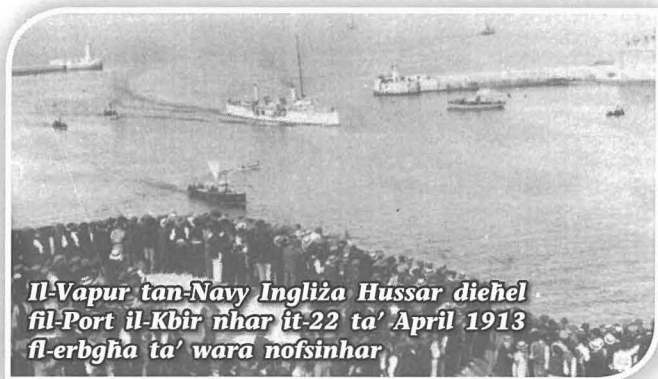
Il-Vapur tan-Navy Ingliża Hussar diehel fil-Port il-Kbir nhar it-22 ta' April 1913 fl-erbgha ta' wara nofsinhar