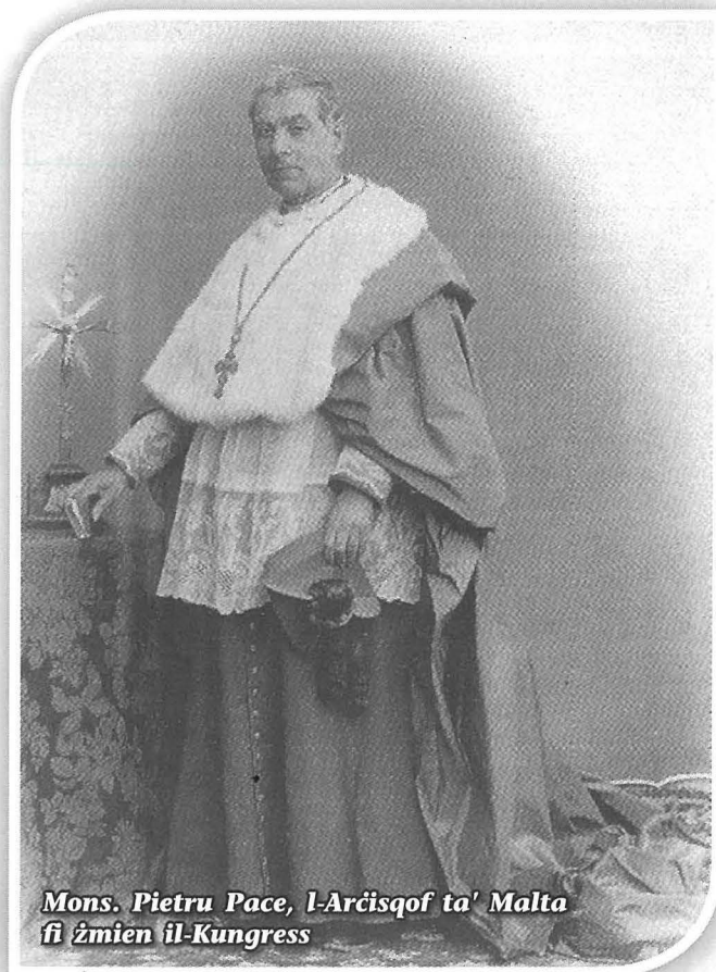
Mons. Pietru Pace, l-Arċisqof ta' Malta fi żmien il-Kungress

l-preżenza ta' Ġesù fil-ħajja tal-bniedem u li permezz ta' din l-għaqda n-Nisrani jifhem aħjar il-missjoni tiegħu f'din id-dinja u hekk tkun mixja kontinwa ma' Kristu Ġesù lejn salvazzjoni shiħa.