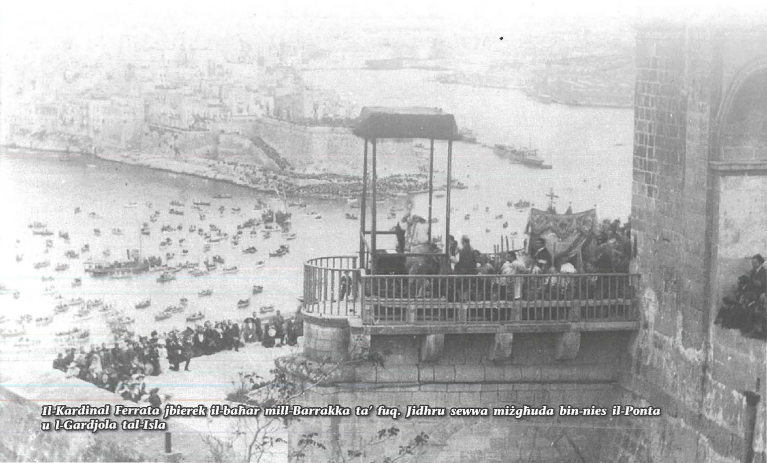
Il-Kardinal Ferrata jbierek il-baħar mill-Barrakka ta' fuq. Jidhru sewwa miżghuda bin-nies il-Ponta u l-Gardjola tal-Isla

Il-Kardinal Santos, wara l-Pontifikal tas-26 ta' April, għamel żjara lill-każin tal-Banda fejn bierek standard u ħalla wkoll kallotta biex tinzamm b'tifkira tiegħu. Din iż-żjara nisslet ferħ kbir fil-poplu tal-Isla.