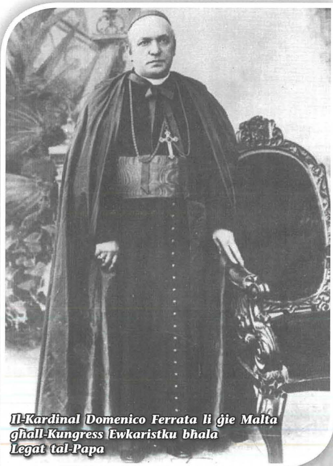
Il-Kardinal Domenico Ferrata li ġie Malta għall-Kungress Ewkaristiku bħala Legat tal-Papa

L-Arċisqof ta' dak iż-żmien, Mons. Pietru Pace hass li kienet haġa tassew utli għan-Nisrani Malti li jisma', jixtarr, jitgħallem u jitlob anke bl-Ewkaristija u għalhekk kien għamel talba formali lill-Papa ta' dak iż-żmien San Piju X sabiex il-Kungress li jmiss isir fid-djoċesi ta' Malta. Talba li ġiet aċċettata u milqugħa b'ferħ kbir. Dan kien l-24 Kungress Ewkaristiku Internazzjonali u hawn se naraw kif dan sehħ, u mhux inqas kif il-Parroċċa tal-Isla tat sehemha fil-hidma u fl-organizzazzjoni tiegħu.