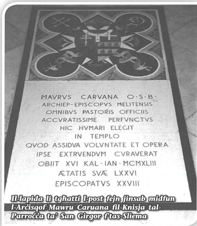
Il-lapida li tgħatti l-post fejn jinsab midfun l-Arċisqof Mawru Caruana fil-Knisja tal-Parroċċa ta' San Ġirgor f'tas-Sliema

L-Isqof Caruana ħabb tassew lill-Isla u dan urieh b'ħafna modi. Kemm membri tal-kleru Senglean kien għażel biex imorru bhala ragħajja f'għadd ta' Parroċċi ta' Malta! Bhala segretarju djoċesan ħatar lil Dun Manwel Galea, Senglean maħbub minn kulhadd u għalhekk wiehed ma jiskanta xejn li ffit żmien wara pproponieh lill-Papa Piju XII biex isir l-Awżiljarju tiegħu. Fil-fatt, Dun Manwel Galea sar Isqof fl-1942.