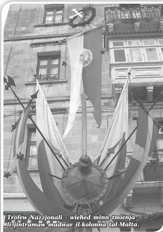
Trofej Nazzjonali - wieħed minn tmienja li jintramaw madwar il-kolonna tal-Malta.