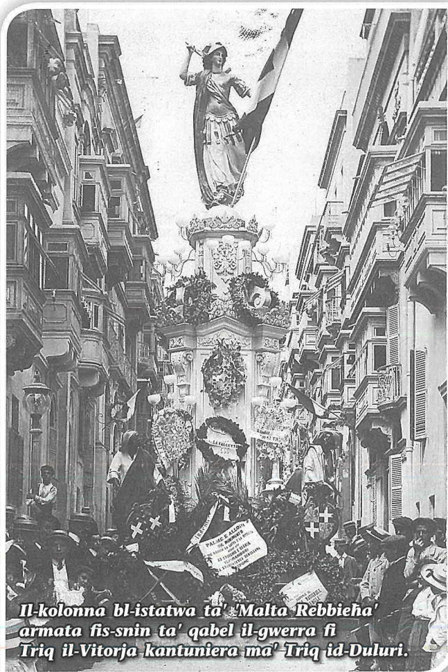
Il-kolonna bl-istatwa ta' Malta Rebbieħa armata fis-snin ta' qabel il-gwerra fi Triq il-Vitorja kantuniera ma' Triq id-Duluri.

Din il-kolonna kbira b'erba' panewijiet għoljin, għandha fil-kantunieri tagħha, erba' Torok, fosthom mara, b'harsithom 'l fuq lejn l-istatwa