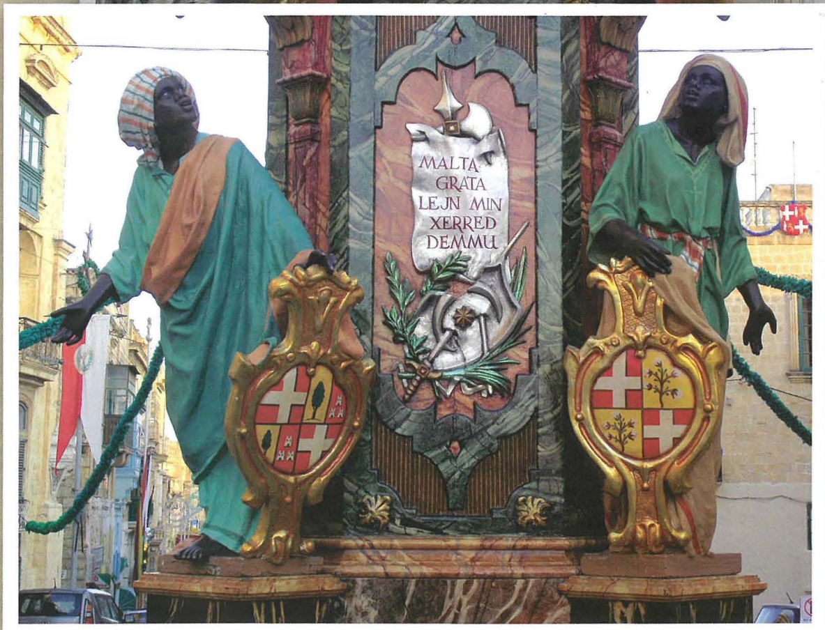
Statwi t'erba' Torok iżejnu l'erba' rkejjien ta' din il-kolonna. Wiehed iżomm l-iskudu tal-Gran Mastru La Sengle u iehor bl-iskudu tal-Gran Mastru La Vallette fuq quddiem (fuq) filwaqt li iehor juri l-istemma tal-Gran Mastru D'Homedes u Torka bl-iskudu tal-Gran Mastru Cottoner fuq wara (isfel)