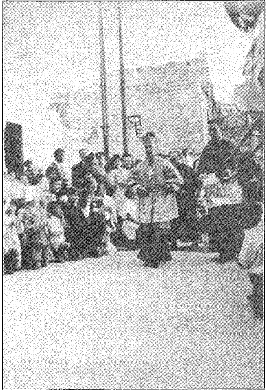
Iż-żjarat ta' spiss li kien jagħmel Mons. Arċisqof Gonzi fil-Kalkara

J'Alla San Ġużepp, Patrun ta' din il-parroċċa jieħu ħsieb u jsaħħah l-ulied tagħha biex flimkien mal-kleru, johlqu komunità ta' fidi, tama u mħabba.