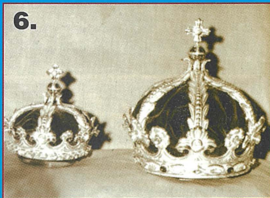
5. L-Arcisqof Mikiel Gonzi qed ipogġi l-kuruni fuq ras San Gūzepp u l-Bambin.