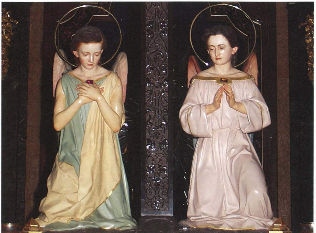
Par anġli adoraturi minqax fl-injam minn Vincenzo Bonnici għall-istatwa tas-Salib Imqaddes fil-parroċċa ta' Bormla