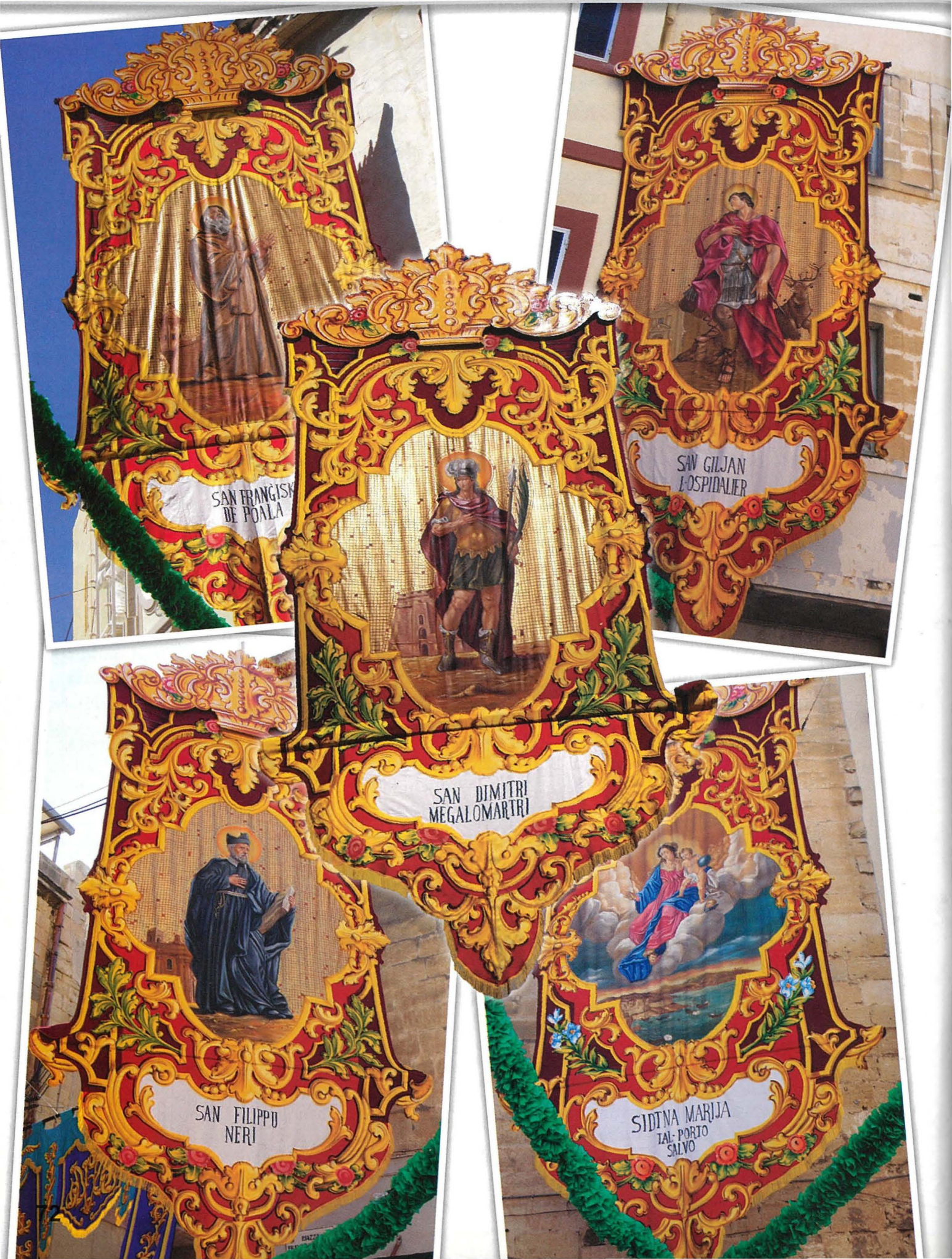
SAN FRANGISK DE POALA