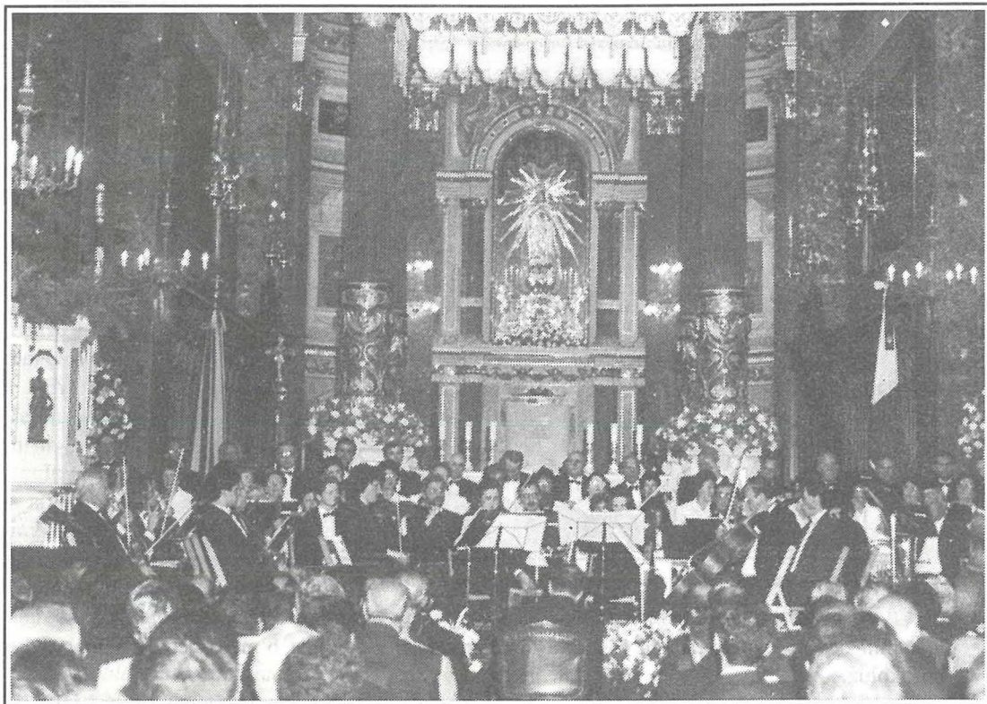
Mument waqt l-Akkademja Mużiko-Letterarja tat-12 ta' April 1996

•It-3 ta' Jannar 1921 meta l-istess Papa ghoġbu wkoll jgholli l-knisja taghna ghad-dinjità ta' Bażilika Minuri, u żejjinha bil-privileġġi u d-drittijiet kollha li ghandhom il-Bażilici Minuri ta' Ruma.