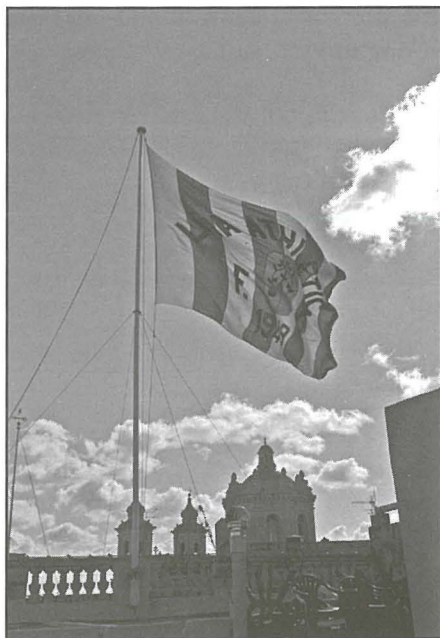
Il-bandiera tal-każin tal-Futbol Lija Athletic tidher tittajjar fuq il-bejt tal-każin.