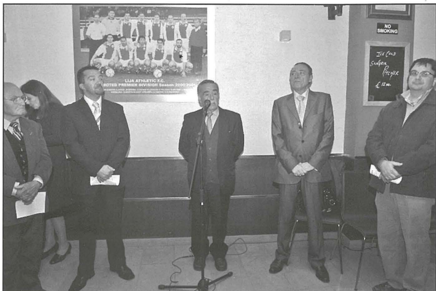
Il-President ta' Lija Athletic jidher qed jaghmel diskors tal-okkazjoni