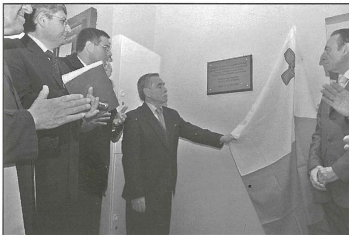
Il-President jidher qed jilxeq lapida tal-okkażjoni.