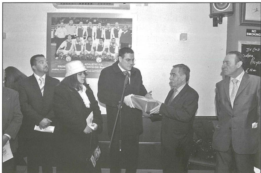
Is-Sindku P'isem il-Kunsill Lokali jidher qed jaghti rigal tal-okkazjoni