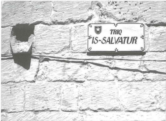
L-isem tat-triq li fiha tinsab il-kappella tas-Salvatur; b'emblema tar-raħal fejn tinsab il-Qrendi.

Appena tidhol mill-bieb prinċipali, fuq l-istess bieb għandek issib gallarija tal-gebel li gġib id-data ta' 1876. Minhabba ċ-ċokon u l-ispazju ristrett, ma kienx possibli li jsir taraġ għaliha, għalhekk biex titla' għaliha trid tagħmel dan b'sellum.