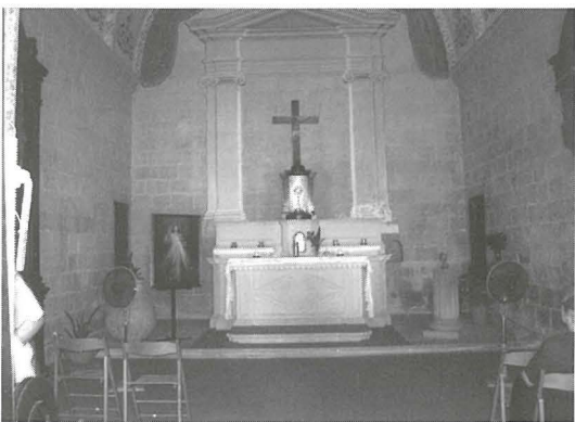
L-uniku artal li jinsab fil-kappella llum b'Ġesù Sagramentat espost matul il-ġurnata għall-qima tal-poplu.