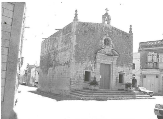
Il-faċċata u l-posizzjoni li tinsab f'nofs it-triq. Wieheġ jinnota ix-xebħ li jinsab bejn din il-kappella u l-knisja ta' Sant' Andrija.