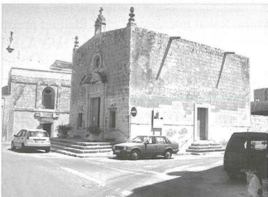
In-naħa tax-xellug tal-kappella elevata mi't-triq u biex tasal ġewwa trid titla' t-taraġ, kemm fil-faċċata u anke fil-ġenb.