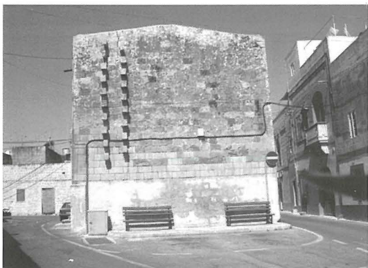
Il-kappella min-naħa ta' wara wieħed jinnota l-aċċess għal fuq il-bejt. Interessanti kif jinthalaq b'sellum, minn taħt il-ġebel maħruġ 'il barra, li l-istess ġebel iservi biex tilhaq il-bejt.