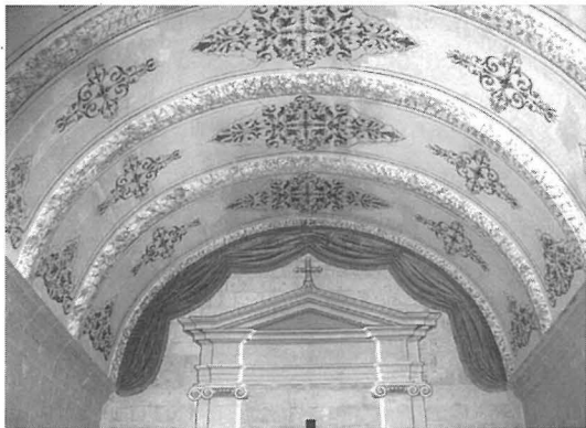
Id-disinn fil-korsija tas-saqaf li tinsab f'din il-kappella li hija miżmuma fi stat stupend.

Temmejna l-mixja ta' din id-darba li ħaditna l-Qrendi u għamilna ħolqa oħra fil-katina tal-kultura tas-Salvatur ġewwa Malta u Ghawdex. Grazie