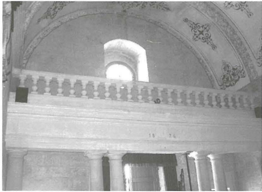
Il-gallerija li tinsab fuq il-bieb prinċipali. Gallerija tal-gebel bil-banavostri, imdawla minn tieqa għal aktar dawl. Kif tindika d-data din il-gallerija tmur lura għad-data ta' 1876.

Il-kappella għandha artal wiehed u l-unika biċċa pittura li kien fiha kienet turi lil Ġesù bid-dinja f'idejh buex tirrappreżenta lil Ġesù Salvatur u sultan tad-dinja. L-Isqof Labini (1780-1807) kien ordna indulgenza ta' 40 gurnata għal min jitlob it-talba tal-Missierna quddiem din ix-xbieha. Din il-pittura llum hija mitlufa.